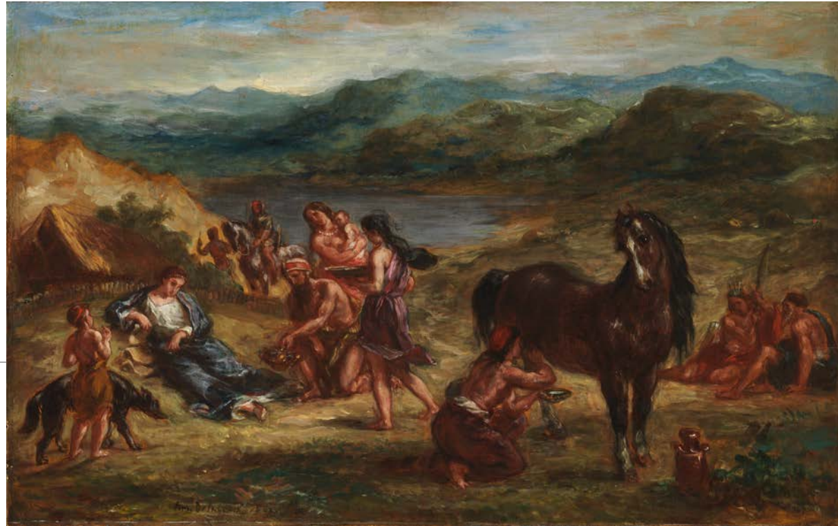
« Ovide chez les Scythes » d'Eugène Delacroix (1859)